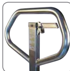
Ergonomiskt handtag ger användaren ett avslappnat grepp.