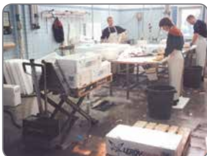
RF-SEMI för livsmedelsindustrin till de områden där hygienkraven är mindre men korrosionsskyddet viktigt.