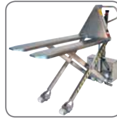
Heltäckta gafflar betyder lättare rengöring och färre gömställen för bakterier.