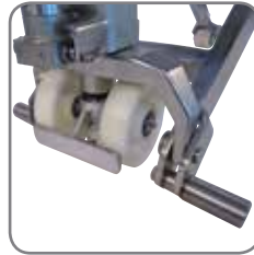
Optimal säkerhet: Stöbena vid styrhjulen, fotskydd och central placering av alla reglage på handtaget.

EHL RF-SEMI: Rostfritt handtag, axlar och hjulhållare. Övriga delar har en polymer plastbeläggning eller kromatiserade. Batteriindikator extra lackförsäglad.