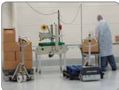
RF-PLUS för livsmedels- och läkemedelsindustrin där det ställs stora krav på hygien och rengöring.

* Kapaciteten övergår från 1500 kg till 1000 kg vid lyfthöjden 470 mm.