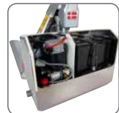
Vattenskyddad inkapsling av lyftmotorn (EHL RF-PLUS).

Fråga efter materialspecifikationer eller besök www.logitrans.com . Vi erbjuder också kundpassade lösningar.