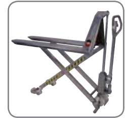
Den manuella saxlyftvagnen finns också i ett explosions-skyddad utförande.