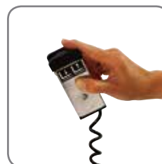
Fjärrmanövrering, även trådlös, finns som extra tillbehör (EHL).